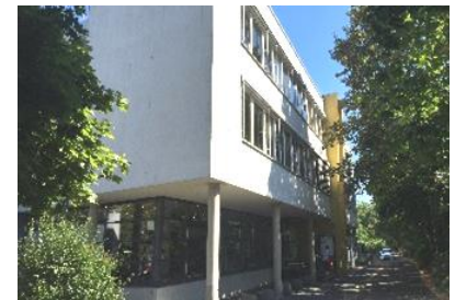
Jobcenter Ludwigstraße 51a

zuständig für alle Menschen aus der Stadt Gießen