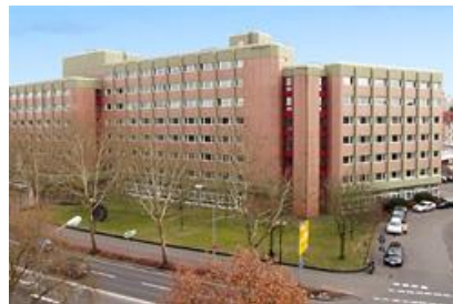
Jobcenter Nordanlage 60

zuständig für alle Menschen aus dem Landkreis Gießen